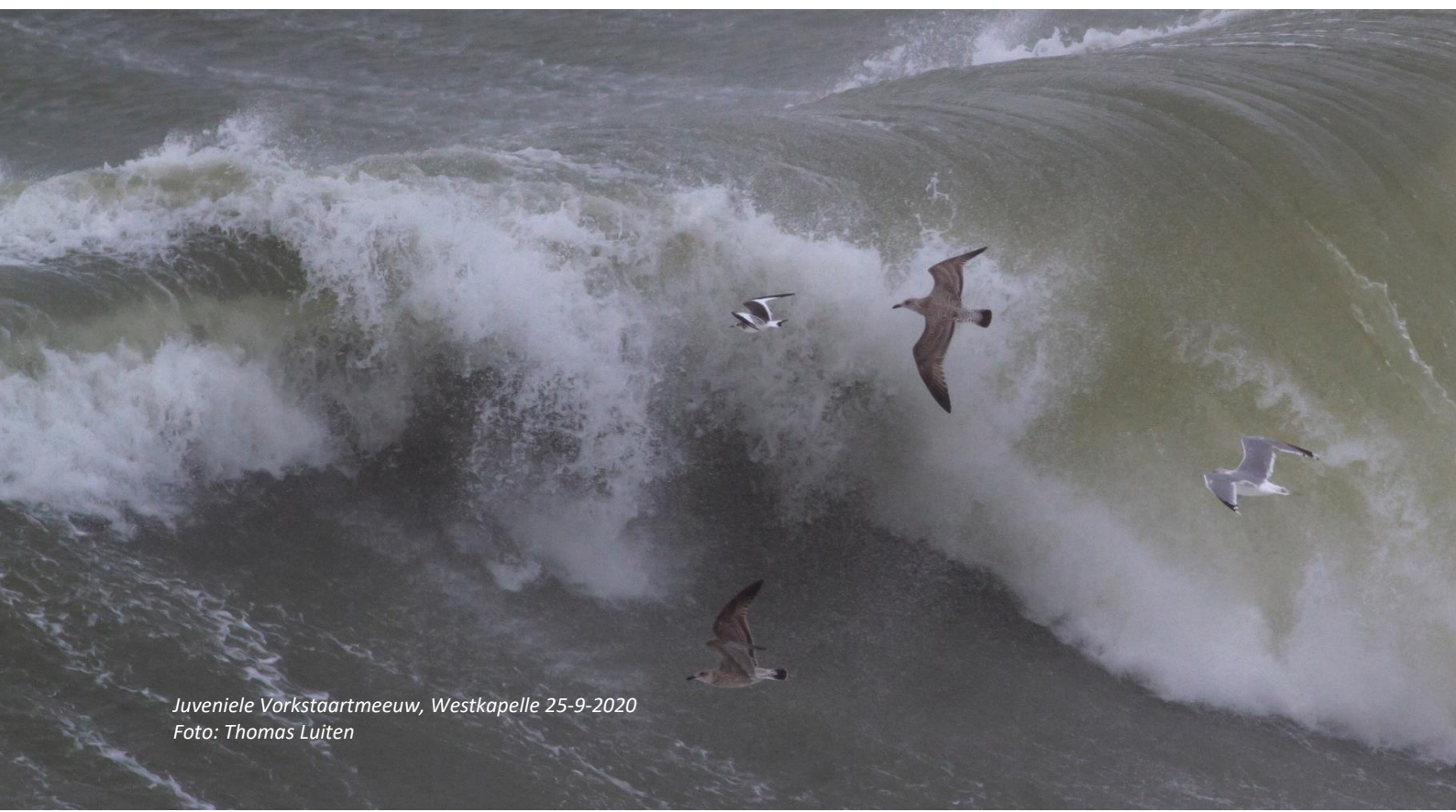
Juvenile Vorkstaartmeeuw, Westkapelle 25-9-2020

De resulterende trends worden gepubliceerd op de website van Sovon ( www.sovon.nl/nl/soort/ onder 'Aantalsontwikkeling') en in de jaarlijkse watervogelrapportages. Voor het tijdschrift Limosa gaan we een artikel schrijven waarin we uitgebreider ingaan op de methoden en resultaten.