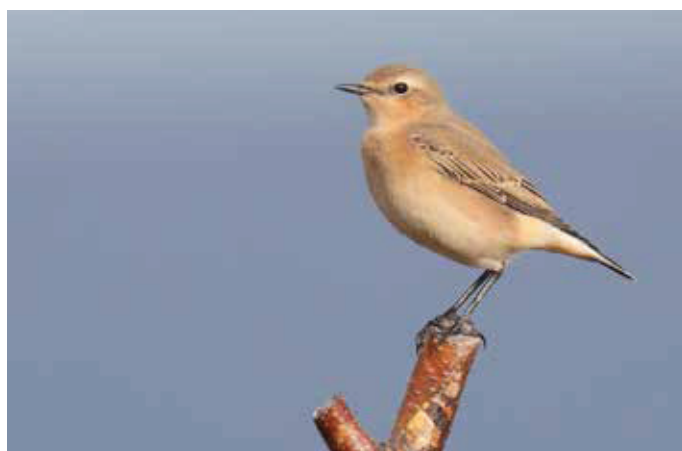
▶ Tapuit Oenanthe oenanthe . 28/08/2018. Maatheide, Lommel (L). Tapuiten die in Alaska broeden migreren naar Oost-Afrika via een trans-Aziatische route die op basis van eenvoudige oriëntatie-regels door computermodellen gesimuleerd kan worden.

Om te bepalen welke van de kompas oriëntatiestrategieën door vogels worden aangewend in de echte wereld kunnen we trekroutes van gezenderde vogels vergelijken met theoretische simulaties. Dat is onder meer onderzocht door Susanne Åkesson en Giuseppe Bianco van de Universiteit van Lund (Zweden). Zij testten vier hypothetische kompas oriëntatiestrategieën met real-life tracking data van diverse zangvogels en steltlopers (Åkesson & Bianco 2017). De dataset omvatte enkele van 's werelds langste vogelmigraties, waaronder de trans-Aziatische trek van Tapuiten Oenanthe oenanthe tussen Alaska en Oost-Afrika. Åkesson en Bianco konden maar liefst twee derde van deze migraties met redelijke nauwkeurigheid simuleren aan de hand van een eenvoudig 'magnetoclinisch' kompas. In het geval van de Tapuiten kon de gehele najaarsroute en voorjaarsroute gesimuleerd worden met slechts een enkele switch in trekrichting (een zogeheten Zugknick) in Centraal-Azië, wat ook hun belangrijkste stop-over gebied is in beide seizoenen. Deze en vergelijkbare studies (zie ook Alerstam 2005, Muheim et al. 2018) geven dan ook aan hoe de complexe en diverse trekpatronen die we waarnemen in de vrije natuur tot stand kunnen komen dankzij relatief eenvoudige oriëntatiecapaciteiten, waarvan we ook nog eens langs experimen-