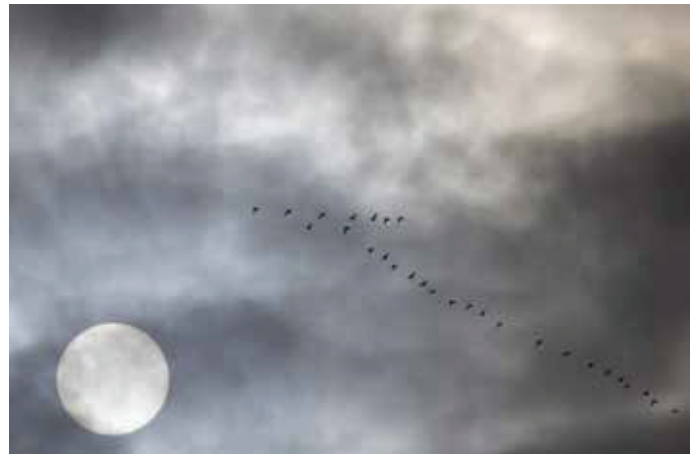
▶ Kolganzen Anser albifrons . 06/10/2016. Voorhaven Brussel. (Foto: Maurice Segers). Zon en sterren zijn nuttige bakens voor oriëntatie en navigatie, maar als die door wolken worden versluierd kunnen vogels nog steeds navigeren op het aardmagnetisch veld of andere omgevingsfactoren.

Northern Wheatear Oenanthe oenanthe. 28 August 2018. Maatheide, Lommel (L) (Photo: Eddy Vaes). Wheatears breeding in Alaska migrate to Eastern Africa via a trans-Asiatic route that can be simulated by computer models using very simple orientation rules.