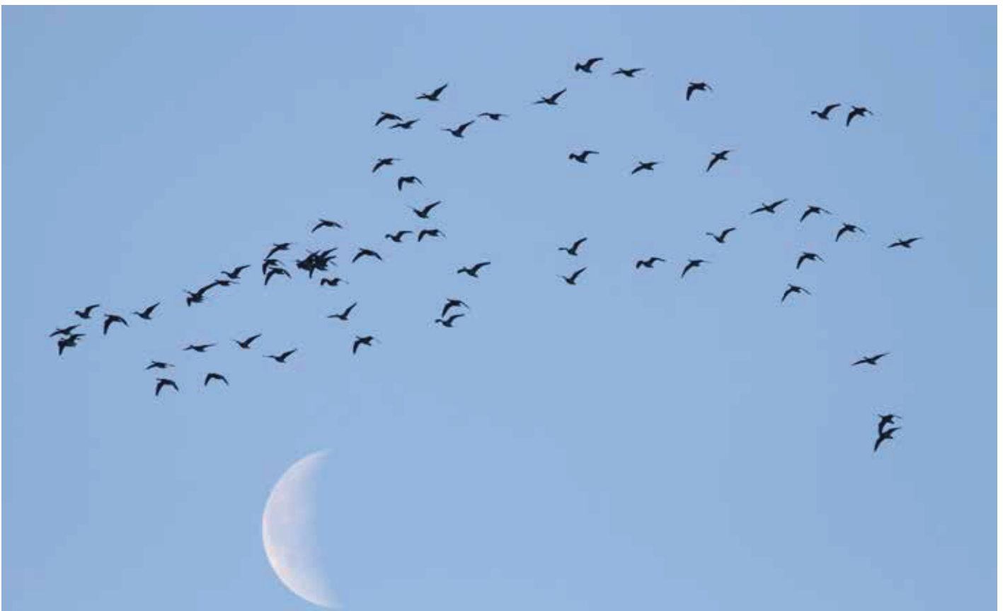
» Brandgans Branta leucopsis . 17 februari 2020. De Horde, Lopik (NL)