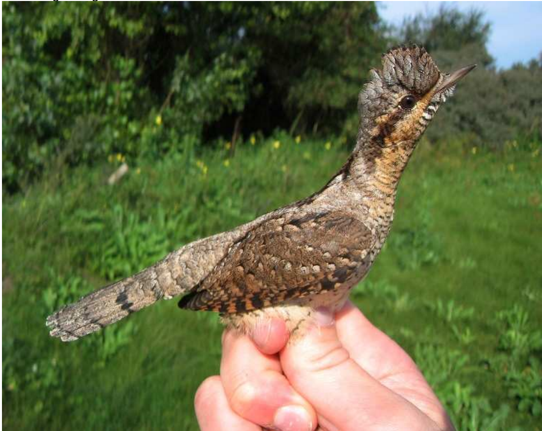
Draaihals, Meijndel 31 augustus 2008

Natúúrlijk gingen we de dag erop meteen ringen. Het weer was goed en er moest gebak gegeten worden met onze collega's uit Meijndel. Er was immers wat te vieren. De hoge