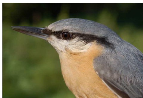
Verrassende vangsten hoeven niet altijd zeldzame vogels te betreffen. Links een mannetje huismus, gevangen op 14 september door Kasper Hendriks, Vincent van der Spek en Wouter Teunissen, rechts een boomklever, op 25 september gevangen door Maarten Verrips en Rinse van der Vliet.