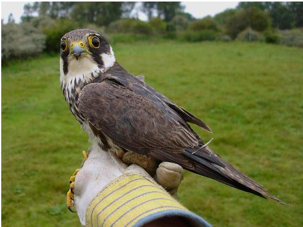
Boomvalk, tweedejaars vogel. Op deze foto is het contrast tussen de ongeruide (bruingrijze) dekveren en de geruide, blauwe rugveren goed zichtbaar. Meijndel, 27 augustus 2008. Ringer: Maarten Verrips

Verrassende vangsten in deze periode waren een boomvalk op 27 augustus, een putter en een sperwergrasmus op de 30 e en een draaihals, een grote karekiet en een noordse nachtegaal op de 31 e . Deze vangst is inmiddels door de CDNA aanvaard.