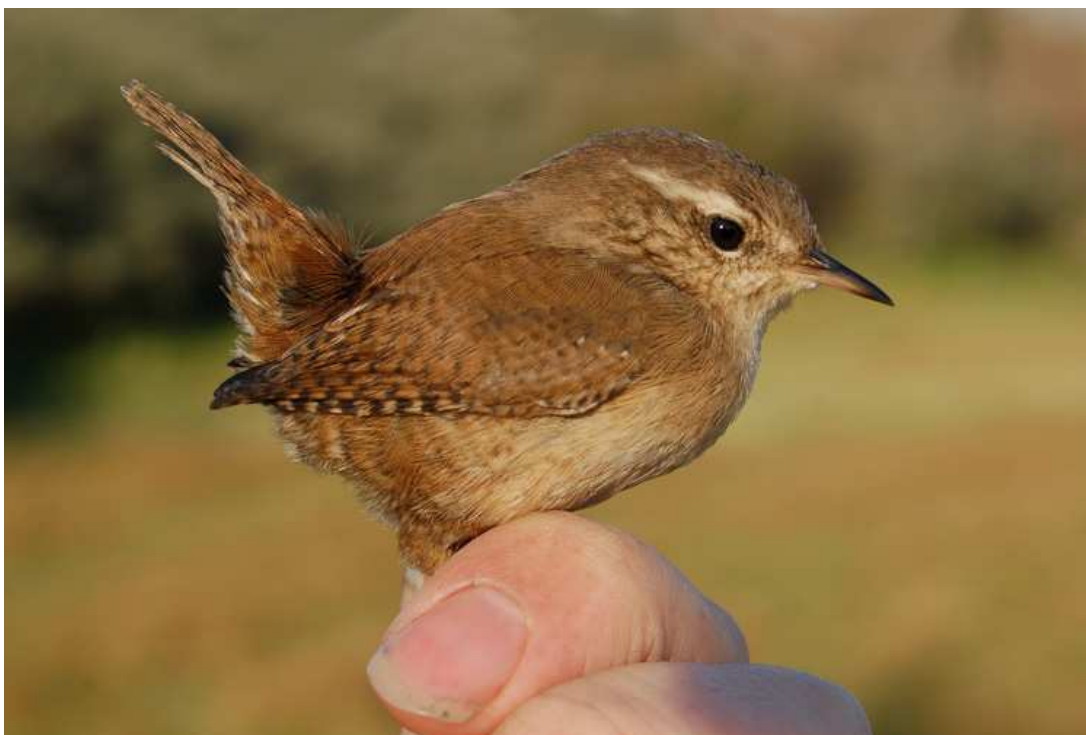
Het aantal gevangen winterkoningen tijdens het CES-project lag in 2008 hoger dan ooit en bedroeg ruim tweemaal zo veel als het langjarig gemiddelde. Meijendel, 2 november 2008. Ringers: Wijnand Bleumink, Ben Wielstra, Wouter Teunissen en Vincent van der Spek

Van de gecontroleerde overjarige vogels is iets meer dan de helft in 2008 geringd. Van de in eerdere jaren teruggevangen overjarige vogels is 40 % in het eerste levensjaar geringd. De oudste afgelezen vogel was een heggemus, als 1K geringd op 20 juli 2003.