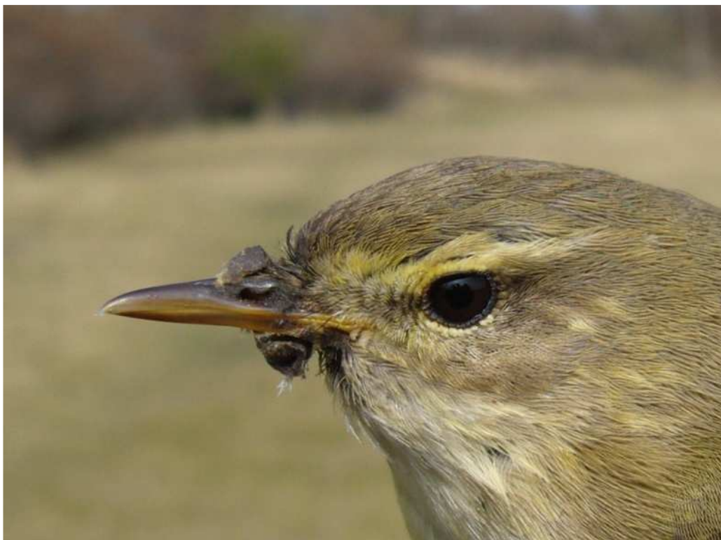
Adulte fitis met 'kleimasker'. Dit merkwaardige verschijnsel hebben we de laatste jaren enkele malen vastgesteld, uitsluitend bij fitis en tijtjaf. Er is wel verondersteld dat we te maken hebben met aangekoekt stuifmeel, maar dat wordt binnen de ringgroep betwijfeld. Maar wat het dan wel is? Meijendel, 11 april 2008. Ringers: Wouter Teunissen en Maarten Verrips