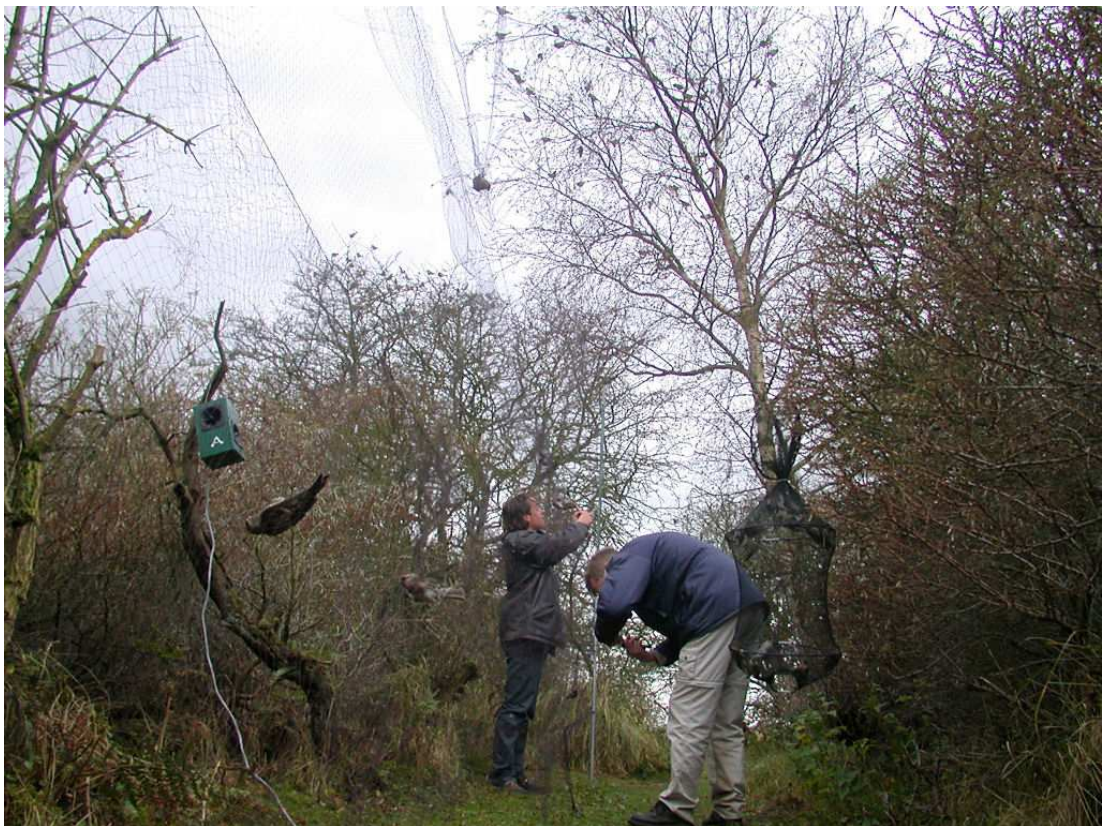
Typerend beeld van de barmsijzeninvasie. Rinse van der Vliet en Maarten Verrips zijn nog bezig de laatste gevangen vogels te bevrijden terwijl boven hen de boom alweer vol zit met nieuw aangekomen barmsijzen. 388 werden er deze dag geringd! Meijndel, 23 november 2008

November bracht opnieuw een grote invasie van barmsijzen. Het verloop was evenwel anders dan in voorgaande jaren. De influx werd pas op 17 november manifest en de absolute piek viel tussen 23 en 25 november. Hoewel de overgrote meerderheid uit grote barmsijzen bestond moest een ongewoon hoog percentage als 'barmsijs' zonder nadere aanduiding van de ondersoort worden geringd omdat ze onmogelijk nader te determineren waren. Mogelijk zijn dit hybriden van kleine en grote barmsijs, maar het is ook mogelijk dat dit het gevolg was van het feit dat deze invasie uit een andere richting kwam dan anders. Daarop kan ook de controle wijzen van een in Polen geringde grote barmsijs, die op 24 november werd gevangen.