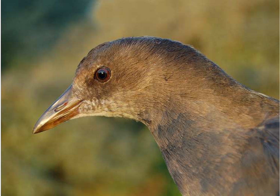
Portretopname van waterhoen in volledig jeugdkleed. Meijndel, 25 oktober 2008. Ringer: Vincent van der Spek