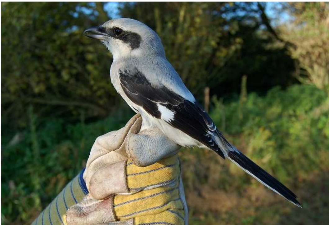
Bijzondere vangsten: een overjarig mannetje pestvogel (1 november, linksboven), een volgroeid mannetje kleine bonte specht (11 oktober, rechtsboven) en een juveniel mannetje klapekster (onder, 9 oktober). De klapekster bleek in staat dwars door de door de ringer gedragen werkhandschoen heen te bijten.