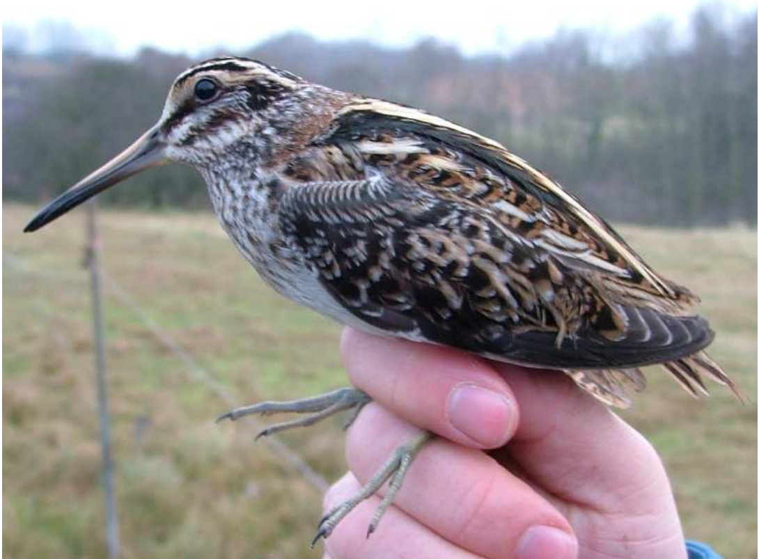
Misschien wel de mooiste en in elk geval de meest mystieke steltloper van dit jaar was dit bokje dat op 29 november in de ochtendschemering werd gevangen. Ringer: Wouter Teunissen