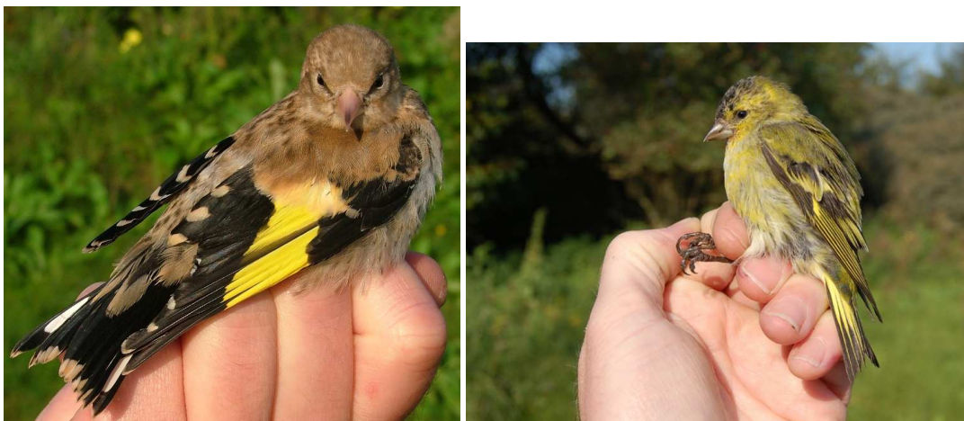
Juvenilele putter (links, 30 augustus) en adult mannetje sijs, 18 september 2008. Ringers: Vincent van der Spek, Maarten Verrips en Ben Wielstra